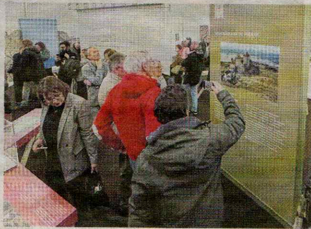
Une inauguration qui a accueilli beaucoup de visiteurs.

Ici, à l'inverse des autres régions de France, l'allure des châteaux varie en fonction, non seulement du terrain d'assiette, mais aussi de la richesse de ses propriétaires. Différentes maquettes, jeux de construction, dispositifs de manipulation et vidéos projetées font de cette exposition un véritable outil d'apprentissage, à destination non seulement de tous les publics, mais aussi des familles et scolaires, en particulier. Avant d'en tirer le rideau, l'on pourra s'interroger sur le devenir de ces